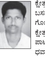
ಕೊಕ್ಕನೂರು ಗ್ರಾಮದಲ್ಲಿ ಉಳಿದ 10 ಸ್ಥಾನಗಳಿಗೆ 25 ಅಭ್ಯರ್ಥಿಗಳು ಮತ್ತು

ಮಲೇನೂರು, ಡಿ. 20 - ಕೊಕ್ಕನೂರು ಗ್ರಾಮ ಪಂಚಾಯಿಯ ಒಟ್ಟು 21 ಸ್ಥಾನಗಳಲ್ಲಿ 4 ಸ್ಥಾನಗಳಿಗೆ ಅಪಿರೋಧ ಆಯ್ಕೆಯಾಗಿದ್ದು ಉಳಿದ 17 ಸ್ಥಾನಗಳಿಗೆ 27ರಂದು ಚುನಾವಣೆ ನಡೆಯಲಿದೆ. ಕೊಕ್ಕನೂರು ಗ್ರಾಮದ 3ನೇ ವಾರ್ಡ್‌ನ ಎಸ್ಸಿ ಕ್ಷೇತ್ರದಿಂದ ಬೆಳಕೆರೆ ಶಿವು, 4ನೇ ವಾರ್ಡ್‌ನ ಎಸ್ಸಿ ಕ್ಷೇತ್ರದಿಂದ ಹೆಚ್. ಮಹಾದೇವಪ್ಪ, ಹಳಿಹಾಳ್ ಕೊಕ್ಕನೂರು ಗ್ರಾಮದಲ್ಲಿ ಉಳಿದ 10 ಸ್ಥಾನಗಳಿಗೆ 25 ಅಭ್ಯರ್ಥಿಗಳು ಮತ್ತು