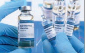
ಕೇಂದ್ರ ಸರ್ಕಾರದ ನಿಯಮಗಳ ಅನ್ವಯ ಕೋ-ವಿನ್ ಚಾಲನೆಗಾಗಿ ಹೆಸರುಗಳನ್ನು ಮತ್ತು

ಬೆಂಗಳೂರು, ಡಿ. 16 - ವೈದ್ಯರೂ ಸೇರಿಂದಂತೆ ಆಸ್ಪತ್ರೆ ಸಿಬ್ಬಂದಿಗಳಿಗೆ ಮೊದಲ ಆದ್ಯತೆಯಾಗಿ ಕೊರೋನಾ ಲಸಿಕೆ ನೀಡುವ ಸಂಬಂಧ ರಾಜ್ಯ ಸರ್ಕಾರ ಕೇಂದ್ರ ಆರೋಗ್ಯ ಸಚಿವಾಲಯದ ಆದೇಶದಂತೆ ಪಟ್ಟಿ ಸಿದ್ಧಪಡಿಸಿ ಕಳುಹಿಸಿದೆ. ಈ ಮೊದಲು ಕೊರೋನಾ ವಾರಿಯರ್‌ನ ಪ್ರತಿಯೊಬ್ಬರಿಗೂ ಮೊದಲ ಆದ್ಯತೆಯಲ್ಲಿ ಲಸಿಕೆ ನೀಡಲು ಕೇಂದ್ರ ತೀರ್ಮಾನಿಸಿತ್ತು. ಆದರೆ, ಈಗಿನ ನಿರ್ಧಾರದ ಪ್ರಕಾರ ಮೊದಲ ಆದ್ಯತೆ ವೈದ್ಯಕೀಯ ಸಿಬ್ಬಂದಿಯಾಗಿದೆ.