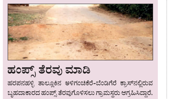
ಹಂಪ್ಸ್ ತೆರವು ಮಾಡಿ ಹರಪಪಟ್ಟ ತಾಲ್ಲೂಕಿನ ಅಳಿಗಂಚಿಕೆ-ಬೆಂದಿಗರ ಕ್ರಾಸ್‌ನಲ್ಲಿರುವ ಬೃಹದಾಕಾರದ ಹಂಪ್ಸ್ ತೆರವುಗಳ ಸಲುವು ಗ್ರಾಮಸ್ಥರು ಆಗ್ರಹಿಸಿದ್ದಾರೆ.

ನವದೆಹಲಿ ಡಿ. 6 - ಕೆಳ ನ್ಯಾಯಾಲಯಗಳು ಆನ್‌ಲೈನ್ ಮೂಲಕ ವಿಚಾರಣೆ ನಡೆಸುವ ಸಾಮರ್ಥ್ಯವನ್ನು ಹೆಚ್ಚಿಸಲು 2,506 ನ್ಯಾಯಾಲಯ ಸಂಕೀರ್ಣಗಳಲ್ಲಿ ವಿಡಿಯೋ ಕಾನ್ಫರೆನ್ಸ್ ಕ್ಯಾಬಿನ್‌ಗಳನ್ನು ಸ್ಥಾಪಿಸಲು ಕೇಂದ್ರ ಕಾನೂನು ಇಲಾಖೆ ಅನುದಾನ ಬಿಡುಗಡೆ ಮಾಡಿದೆ ಎಂದು ಅಧಿಕಾರಿಗಳು ತಿಳಿಸಿದ್ದಾರೆ. ಸೆಪ್ಟೆಂಬರ್‌ನಲ್ಲಿ ವಿಡಿಯೋ ಕಾನ್ಫರೆನ್ಸ್ ಕ್ಯಾಬಿನ್‌ಗಳಿಗಾಗಿ 5.21 ಕೋಟಿ ರೂ.ಗಳನ್ನು ಬಿಡುಗಡೆ ಮಾಡಲಾಗಿತ್ತು. ಅಕ್ಟೋಬರ್‌ನಲ್ಲಿ ಹೆಚ್ಚುವರಿ ವಿಡಿಯೋ ಕಾನ್ಫರೆನ್ಸ್ ಉಪಕರಣಗಳ ಖರೀದಿಗೆ 28.88 ಕೋಟಿ ರೂ.ಗಳನ್ನು ಬಿಡುಗಡೆ ಮಾಡಲಾಗಿದೆ ಎಂದು ಅಧಿಕಾರಿಗಳು ತಿಳಿಸಿದ್ದಾರೆ. ಸುಪ್ರೀಂ ಕೋರ್ಟ್‌ನ ಇ- ಸಮಿತಿ ಹಾಗೂ ಕಾನೂನು ಇಲಾಖೆಗಳ ಮೂಲಕ ಈ ಹಣ ಬಿಡುಗಡೆ ಮಾಡಲಾಗಿದೆ. ದೇಶದಲ್ಲಿ 3,288 ನ್ಯಾಯಾಲಯ ಸಂಕೀರ್ಣಗಳಿವೆ. ಇವುಗಳ ಪೈಕಿ 2,506 ನ್ಯಾಯಾಲಯ ಸಂಕೀರ್ಣಗಳು ವಿಡಿಯೋ ಕಾನ್ಫರೆನ್ಸ್ ಕ್ಯಾಬಿನ್ ಹೊಂದಲು ಅನುದಾನ ಬಿಡುಗಡೆ ಮಾಡಲಾಗಿದೆ. ದೊಡ್ಡ ನ್ಯಾಯಾಲಯ ಸಂಕೀರ್ಣಗಳಿಗೆ ಹಲವು ಕ್ಯಾಬಿನ್‌ಗಳನ್ನು ಕಲ್ಪಿಸಲಾಗುವುದು. ಕೊರೊನಾ ಹಿನ್ನೆಲೆಯಲ್ಲಿ ನ್ಯಾಯಾಲಯಗಳು ಆನ್‌ಲೈನ್ ಮೂಲಕ ವಿಚಾರಣೆ ನಡೆಸುವುದನ್ನು ಮುಂದುವರಿಸಿರುವ ಹಿನ್ನೆಲೆಯಲ್ಲಿ ಈ ಕ್ರಮ ತೆಗೆದುಕೊಳ್ಳಲಾಗಿದೆ.