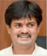
ಕೆರೆ, ಪಾರ್ಕ್, ರಸ್ತೆ ಒತ್ತುವರಿ ಮುಲಾಜಿಲ್ಲದೆ ತೆರವು