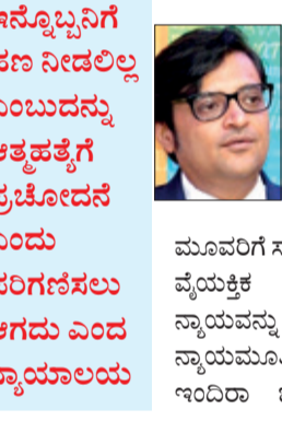
ವ್ಯಕ್ತಿಯೋರ್ವ ಇನ್ಸೂರ್ವಿಗೆ ಹಣ ನೀಡಲಿಲ್ಲ ಎಂಬುದನ್ನು ಆತ್ಮಹತ್ಯೆಗೆ ಪ್ರಚೋದನೆ ಎಂದು ಪರಿಗಣಿಸಲು ಸಾಧ್ಯವಾಗದು ಎಂದು ಹೇಳಿರುವ ಸುಪ್ರೀಂ ಕೋರ್ಟ್, ಪತ್ರಕರ್ತ ಅರ್ನಬ್ ಗೋಸ್ವಾಮಿಗೆ ಜಾಮೀನು ನೀಡಿದೆ.