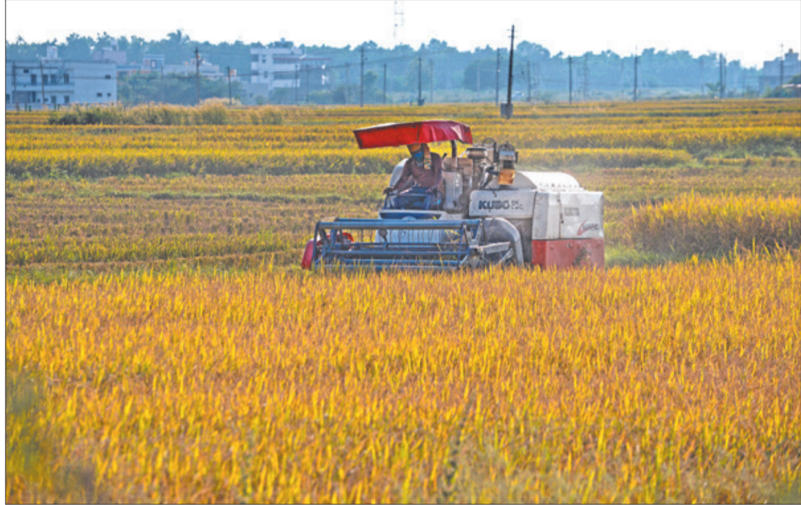
ಭತ್ತದ ಕಟಾವು ಜಿಲ್ಲಾದ್ಯಂತ ಮುಂಗಾರು ಹಂಗಾಮಿನಲ್ಲಿ ಬೆಳೆದ ಭತ್ತದ ಬೆಳೆ ಕಟಾವು ಕಾರ್ಯ ಚುರುಕುಗೊಂಡಿದೆ. ಶಾಮನೂರು ಬೈಪಾಸ್ ಬಳಿಯ ಜಮೀನೊಂದರಲ್ಲಿ ಯಂತ್ರದ ಮೂಲಕ ಭತ್ತದ ಹೈರು ಕಟಾವು ನಡೆಯುತ್ತಿರುವುದು.