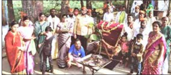
ರಾಣೇಬೆನ್ನೂರಿನ ಶ್ರೀ ರಾಮ ದೇವಸ್ಥಾನದಿಂದ ಬನ್ನಿ ಮಹೋತ್ಸವ ನಿಮಿತ್ತ ಪಲ್ಲಕ್ಕಿಯಲ್ಲಿ ಶ್ರೀ ರಾಮದೇವರ ಮೆರವಣಿಗೆ ನಡೆಸಲಾಯಿತು.