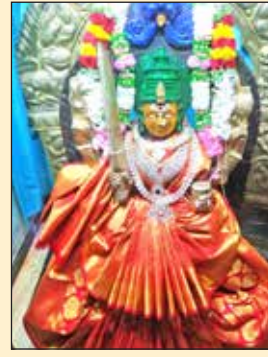
ದಾವಣಗೆರೆ ಪಿ.ಬಿ ರಸ್ತೆಯ ಪಂಚ ದೇವಸ್ಥಾನದ ಶ್ರೀ ಕೊಪ್ಪದಮ್ಮ ದೇವಿಗೆ ವಿಶೇಷ ಅಲಂಕಾರ.