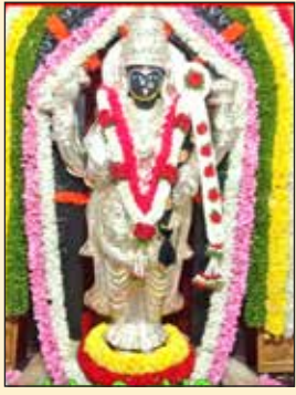
ದಾವಣಗೆರೆ ಡಿವಿಎಂ ಚೌನ್ ಶಿವ್ ನಲ್ಲಿರುವ ಶ್ರೀ ವಾಸವಿ ದೇವಸ್ಥಾನದಲ್ಲಿ ಶ್ರೀ ಅಮ್ಮನವರಿಗೆ ರಜತ ಅಲಂಕಾರ.