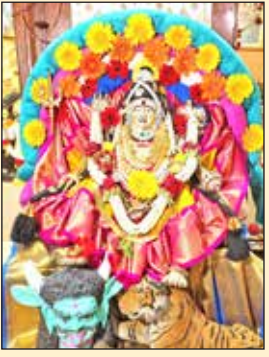
ದಾವಣಗೆರೆ ಎಸ್.ಓ.ಜಿ ಕಾಲೋನಿ ಶ್ರೀ ಶನೈಶ್ವರ ಸ್ವಾಮಿ ದೇವಸ್ಥಾನದಲ್ಲಿ ಶ್ರೀ ಚೌಡೇಶ್ವರಿ ಅಮ್ಮನವರಿಗೆ ದುರ್ಗಾದೇವಿ ಅಲಂಕಾರ.