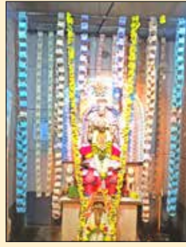
ದಾವಣಗೆರೆ ದಾವಲ್‌ಪೇಟೆಯ ತೋಟವೀರ ಸಮಾಜದ ಶ್ರೀ ಚೌಡೇಶ್ವರಿ ಅಮ್ಮನವರಿಗೆ ಸೋಟಿನ ಅಲಂಕಾರ.