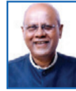
Shri Gowdar Mallikarjunappa Siddeshwara Hon'ble Member of Parliament, Govt. of India