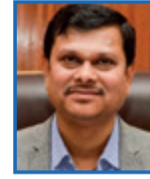
Shri Mahantesh Belagi, IAS Deputy Commissioner & District Magistrate, Davanagere District