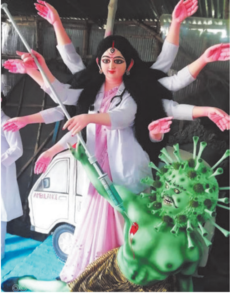
ಕೋವಿಡ್ ದುರ್ಗ ...

ಪಶ್ಚಿಮ ಬಂಗಾಳದಲ್ಲಿ ದುರ್ಗ ಪೂಜೆ ಸಂಭ್ರಮದಿಂದ ನಡೆಯುತ್ತಿದ್ದು, ವೈದ್ಯ ರೂಪದ ದುರ್ಗ ದೇವಿಯು ಕೋರೋನಾ ವೈರಸ್ ನಿಗ್ರಹಿಸುತ್ತಿರುವ ಮೂರ್ತಿಯನ್ನು ಕೋಲೊತ್ತಾದಲ್ಲಿ ಪ್ರತಿಷ್ಠಾಪಿಸಲಾಗಿದ್ದು, ಈ ಚಿತ್ರ ಸಾಮಾಜಿಕ ಜಾಲ ತಾಣಗಳಲ್ಲಿ ವೈರಲ್ ಆಗಿದೆ.