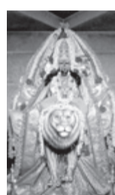
ನಿಟ್ಟುವಳಿ ದುಗ್ಗಮ್ಮ ದೇವಸ್ಥಾನ : ದಾವಣಗೆರೆ - ನಿಟ್ಟುವಳಿಯ ಶ್ರೀ ದುರ್ಗಾಬಾಯಿ ದೇವಿಗೆ ನವರಾತ್ರಿಯ ಮೂರನೇ ದಿನದಂದು ಚಂದ್ರಘಂಟ ಅಲಂಕಾರ (ಸಿಂಹ ಪಾಟಿ) ಮಾಡಲಾಗಿತ್ತು.

-ಶ್ರೀ ಕೃಷ್ಣಾರ್ಪಣಮಸ್ತು ಡಾ. ರೂಪಶ್ರೀ ಶಶಿಕಾಂತ್