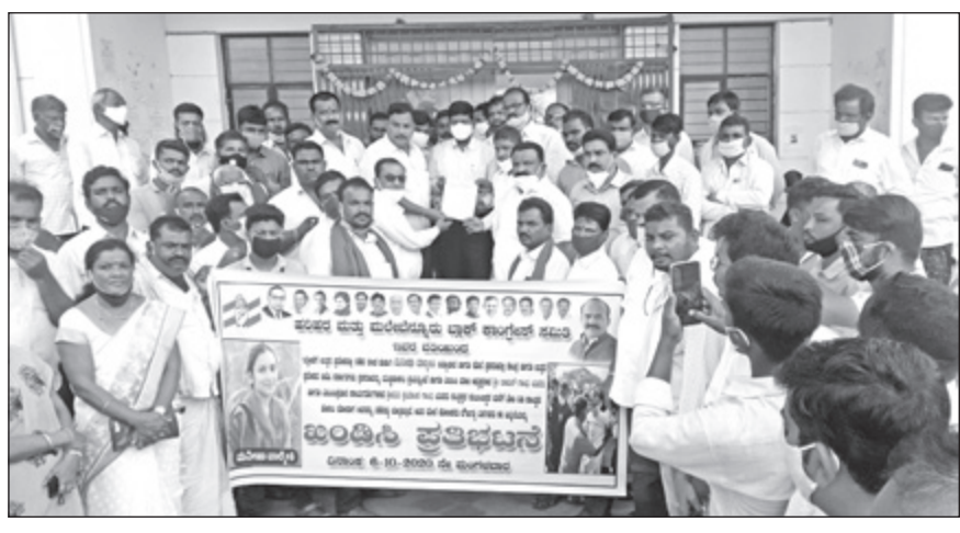
ಅತ್ಯಾಚಾರ, ಕೊಲೆ ಪ್ರಕರಣವನ್ನು ಖಂಡಿಸಿ ಹರಿಹರದಲ್ಲಿ ಕಾಂಗ್ರೆಸ್ ಪ್ರತಿಭಟನೆ