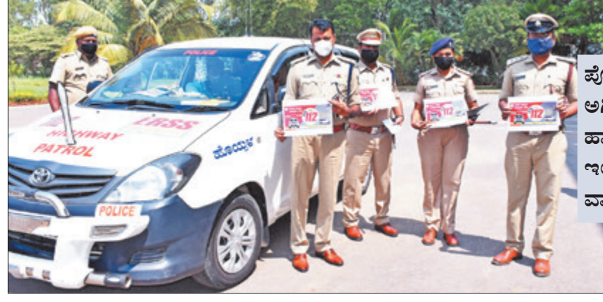
ಜಿಲ್ಲೆಯಲ್ಲಿ ತುರ್ತು ನೆರವಿಗೆ 13 'ಹೊಯ್ಯಳ' ವಾಹನಗಳನ್ನು ಜಿಲ್ಲಾ ಪೊಲೀಸರು ಸಜ್ಜುಗೊಳಿಸಿದ್ದಾರೆ.