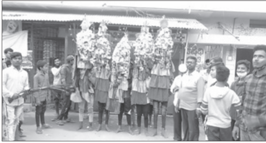
ನಿಟ್ಟುವಳ್ಳಿಯಲ್ಲಿ ಪೀರ್ ದೇವರ ಮೆರವಣಿಗೆ

ಮೊಹರಂ ಆಚರಣೆ ಹಿನ್ನೆಲೆಯಲ್ಲಿ ದಾವಣಗೆರೆ - ನಿಟ್ಟುವಳ್ಳಿಯ ಸೈಯದ್ ಪೀರ್ ಬಡಾವಣೆಯಲ್ಲಿ ಪೀರ್ ದೇವರ ಮೆರವಣಿಗೆಯು ಸೋಮವಾರ ನಡೆಯಿತು.