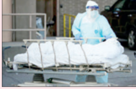
ತಪ್ಪಿಸಬೇಕು ಎಂದು ಆದೇಶದಲ್ಲಿ ಸ್ಪಷ್ಟವಾಗಿ ತಿಳಿಸಲಾಗಿದೆ. ಪ್ರತಿಯೊಂದು ಸಾವಿನ ಸಂದರ್ಭದಲ್ಲೂ ಕೊರೊನಾ ಪರೀಕ್ಷೆಗಾಗಿ ಒತ್ತಾಯಿಸಲಾಗಿದೆ. ಫೈ, ಉಸಿರಾಟದ ತೀವ್ರ ಸಮಸ್ಯೆ ಇದ್ದ ಸಂದರ್ಭದಲ್ಲಿ ಸಾವಿನ ಆರು ಗಂಟೆಯ ಒಳಗೆ ಕೊರೊನಾ ಪರೀಕ್ಷೆಗಾಗಿ ಗಂಟಲು ದ್ರವ ತೆಗೆದುಕೊಳ್ಳಬೇಕು. ಆನಂತರ ವರದಿ ಬರುವವರೆಗೂ ಕಾಯ್ದೇ ಗೌರವದೊಂದಿಗೆ ಶಂಕಿತ ಮೃತದೇಹವನ್ನು ಕುಟುಂಬ

ವಂತಿಲ್ಲ. ಒಂದು ವೇಳೆ ಕುಟುಂಬದವರು ಯಾವುದೇ ಕಾರಣಕ್ಕೆ ಅಂತಿಮ ನಡವಳಿ ತಮ್ಮಿಂದ ಸಾಧ್ಯವಾಗದು ಎಂದು ಹೇಳಿದಾಗ ಮಾತ್ರ ಆರೋಗ್ಯ ಪ್ರಾಧಿಕಾರ ಮೃತದೇಹದ ಅಂತಿಮ ನಡವಳಿ ಎಂದು ಆದೇಶದಲ್ಲಿ ಸ್ಪಷ್ಟವಾಗಿ ತಿಳಿಸಲಾಗಿದೆ. ಅಲ್ಲದೇ ಸುಪ್ರೀಂ ಕೋರ್ಟ್ ಎಲ್ಲಾ ರಾಜ್ಯಗಳಿಗೆ ಕೆಲ ಪ್ರಮುಖ ನಿರ್ದೇಶನಗಳನ್ನು ನೀಡಿದೆ. ರಾಜ್ಯ ಹೈಕೋರ್ಟ್ ಕೆಲ ಟಿಪ್ಪಣಿಗಳನ್ನು ಮಾಡಿದೆ. ಆದರೆ ಅನ್ಯಾಯ ಮೃತದೇಹ ಹಸ್ತಾಂತರಿಸುವ ಮಾರ್ಗಸೂಚಿಗಳಲ್ಲಿ ಬದಲಾವಣೆ ಮಾಡಿರುವುದಾಗಿ ರಾಜ್ಯ ಸರ್ಕಾರ ತಿಳಿಸಿದೆ. ಮೃತರು ಇಲ್ಲವೇ ಕುಟುಂಬದವರನ್ನು ಕಳೆದುಕೊಂಡು ಗುರಿ ಮಾಡಬಾರದು. ಮೃತರ ಘನತೆ ಕಾಯ್ದುಕೊಳ್ಳಬೇಕು ಎಂದು ಆದೇಶದಲ್ಲಿ ತಿಳಿಸಲಾಗಿದೆ. ಕಳೇಬರದ ಗೌರವ, ಕುಟುಂಬದವರ ಸಾಂಸ್ಕೃತಿಕ ಹಾಗೂ ಧಾರ್ಮಿಕ ಸಂಪ್ರದಾಯಗಳನ್ನು ಗೌರವಿಸಬೇಕು ಹಾಗೂ ರಕ್ಷಿಸಬೇಕು. ಮೃತದೇಹವನ್ನು ಅವಸರದಲ್ಲಿ ವಿಲೇವಾರಿ ಮಾಡುವುದನ್ನು ಕಟ್ಟುನಿಟ್ಟಾಗಿ