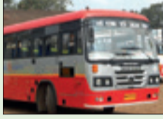
ಎಲ್ಲಾ ಸೀಟುಗಳಲ್ಲಿ ಪ್ರಯಾಣಿಕರು ಕೂರಲು ಅನುಮತಿ

ಬೆಂಗಳೂರು, ಸೆ. 1 - ಕೋವಿಡ್ ಕಾರಣದಿಂದ ರಾಜ್ಯ ರಸ್ತೆ ಸಾರಿಗೆ ಸಂಸ್ಥೆಗಳಲ್ಲಿ ಸೀಮಿತ ಸಂಖ್ಯೆಯ ಪ್ರಯಾಣಿಕರಿಗೆ ಮಾತ್ರ ನೀಡಿದ್ದ ಅವಕಾಶವನ್ನು ಈಗ ವಾಪಸ್ ಪಡೆದು, ಪೂರ್ಣ ಪ್ರಮಾಣದ ಆಸನಗಳಲ್ಲಿ ಪ್ರಯಾಣಿಸಲು ಅನುಮತಿ ನೀಡಲಾಗಿದೆ. ಆದರೆ ನಿಂತು ಬಸ್‌ನಲ್ಲಿ ಪ್ರಯಾಣಿಸಲು ಅವಕಾಶ ಇಲ್ಲ.