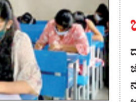
ಎಲ್ಲಾ ಅಭ್ಯರ್ಥಿಗಳು ಮಾಸ್ಕ್ ಹಾಗೂ ಸ್ಯಾನಿಟೈಜರ್ ಜೊತೆಗೆ ಪರೀಕ್ಷಾ ಕೇಂದ್ರ ಪ್ರವೇಶಿಸಲು ಅವಕಾಶ ನೀಡಲಾಗಿತ್ತು. ಪರೀಕ್ಷಾ ಪ್ರಾಧಿಕಾರದ ನೀಡಿದ ಮಾಸ್ಕ್‌ಗಳನ್ನೇ ಅವರು ಬಳಸಬೇಕಿದೆ. ಪ್ರತಿಯೊಬ್ಬ ಅಭ್ಯರ್ಥಿಗೆ ಮೂರು ಪದರದ ಮಾಸ್ಕ್ ನೀಡಲಾಗಿತ್ತು (2ನೇ ಪುಟಕ್ಕೆ)

ನವದೆಹಲಿ, ಸೆ. 1 - ಕಠಿಣ ಮುನ್ನೆಚ್ಚರಿಕೆಗಳ ನಡುವೆ ಜಿಇಇ - ಮೇನ್ಸ್ ಪ್ರವೇಶ ಪರೀಕ್ಷೆ ದೇಶಾದ್ಯಂತ ಮಂಗಳವಾರ ಆರಂಭವಾಗಿದೆ. ಕೊರೊನಾ ಹಿನ್ನೆಲೆಯಲ್ಲಿ ಸಾಮಾಜಿಕ ಅಂತರಕ್ಕೆ ವ್ಯವಸ್ಥೆ ಮಾಡಲಾಗಿತ್ತು. ವಿದ್ಯಾರ್ಥಿಗಳಿಗೆ ಹಂತ ಹಂತವಾಗಿ ಪ್ರವೇಶ ನೀಡುವ ಜೊತೆಗೆ, ಪ್ರವೇಶ ದ್ವಾರದ ಬಳಿ ಸ್ಯಾನಿಟೈಜರ್ ಇರಿಸಲಾಗಿತ್ತು. ಮಾಸ್ಕ್‌ಗಳನ್ನು ವಿತರಿಸಲಾಗಿತ್ತು. ಕೊರೊನಾ ಹಿನ್ನೆಲೆಯಲ್ಲಿ ಎರಡು ಬಾರಿ ಮುಂದೂಡಿಕೆಯಾಗಿದ್ದ ಪರೀಕ್ಷೆಗಳು, ಅಂತಿಮವಾಗಿ ಸೆಪ್ಟೆಂಬರ್ 10ಂದ ಪ್ರಾಧಿಕಾರದ ನೀಡಿದ ಮಾಸ್ಕ್‌ಗಳನ್ನೇ ಅವರು ಆರಂಭವಾಗಿದೆ. ಸೆಪ್ಟೆಂಬರ್ 6ರವರೆಗೆ ಪರೀಕ್ಷೆಗಳು ನಡೆಯಲಿವೆ.