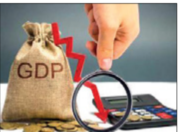
ಮಿಡ್‌ವೆ, ಅನಿಲ, ಜಲ ಪೂರೈಕೆ ಹಾಗೂ ಇತರ ಸೇವೆಗಳ ವಲಯ ಶೇ.7ರ ಇಳಿಕೆಯಾಗಿದೆ. ಕಳೆದ ವರ್ಷ ಈ ವಲಯ ಶೇ.8.8ರ ಬೆಳವಣಿಗೆ ಕಂಡಿತ್ತು. ವ್ಯಾಪಾರ, ಹೋಟೆಲ್, ಸಾರಿಗೆ-ಸಂಪರ್ಕ ಹಾಗೂ ಸೇವಾ ವಲಯಗಳು ಪ್ರಥಮ

ನವದೆಹಲಿ, ಆ. 31 - ಏಪ್ರಿಲ್‌ನಿಂದ ಜೂನ್ ನಡುವಿನ ಪ್ರಥಮ ಚತುರ್ಥದಲ್ಲಿ ಭಾರತದ ಜಿ.ಡಿ.ಪಿ. ಶೇ.23.9ರ ಭಾರೀ ಪ್ರಮಾಣದಲ್ಲಿ ಕುಸಿತ ಕಂಡಿದೆ. ಅದಾಗಲೇ ಮಂದವಾಗಿದ್ದ ಆರ್ಥಿಕ ವ್ಯವಸ್ಥೆಗೆ ಕೊರೊನಾ ಹೊಡೆತ ಬಿದ್ದಿರುವುದೇ ಇದಕ್ಕೆ ಕಾರಣವಾಗಿದೆ. ಇದೇ ಚತುರ್ಥದಲ್ಲಿ ಕಳೆದ ವರ್ಷ ಜಿಡಿಪಿ ಬೆಳವಣಿಗೆ ದರ ಶೇ.5.2ರಷ್ಟು ಎಂದು ರಾಷ್ಟ್ರೀಯ ಅಂಕಿ-ಅಂಶಗಳ ಕಚೇರಿ ತಿಳಿಸಿದೆ. ಕೊರೊನಾ ಹಿನ್ನೆಲೆಯಲ್ಲಿ ಮಾರ್ಚ್ 25ರಂದು ಕೇಂದ್ರ ಸರ್ಕಾರ ರಾಷ್ಟ್ರವ್ಯಾಪಿ ಲಾಕ್‌ಡೌನ್ ಹೇರಿಕೆ ಮಾಡಿತ್ತು. ಇದರಿಂದಾಗಿ ಆರ್ಥಿಕತೆಯ ಎಲ್ಲಾ ವಲಯಗಳ ಮೇಲೆ ಪರಿಣಾಮವಾಗಿದೆ. ಅಂಕಿ-ಅಂಶಗಳ ಪ್ರಕಾರ ಉತ್ಪಾದನಾ ವಲಯದ ಒಟ್ಟು ಮೌಲ್ಯ ವರ್ಧನೆ (ಜಿ.ವಿ.ಎ.) ಶೇ.39.3ರಷ್ಟು ಕುಸಿತವಾಗಿದೆ. ಆದರೆ, ಕೃಷಿ ವಲಯದ ಮೌಲ್ಯ ಶೇ.3.4ರಷ್ಟು ಹೆಚ್ಚಾಗಿದೆ. ಕಳೆದ ವರ್ಷ ಇದೇ ಅವಧಿಯಲ್ಲಿ ಕೃಷಿ ವಲಯದ ಮೌಲ್ಯ ಶೇ.3ರಷ್ಟು ಬೆಳೆದಿತ್ತು. ನಿರ್ಮಾಣ ವಲಯದ ಜಿವಿಎ ಶೇ.50.3ರ ಭಾರೀ ಪ್ರಮಾಣದ ಕುಸಿತ ಕಂಡಿದೆ. ಗಣಿ ವಲಯದಲ್ಲಿ ಶೇ.2.3ರಷ್ಟು ಇಳಿಕೆಯಾಗಿದೆ.