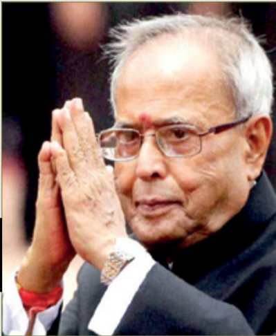
ನಿರ್ಣಾಯಕ ಘಟ್ಟಗಳನ್ನು ನಿರ್ವಹಿಸಿದ ನೇತಾರ

ನವದೆಹಲಿ, ಆ. 31- ದೇಶದ ಅತ್ಯಂತ ಗೌರವಾನ್ವಿತ ಹಾಗೂ ಮೆಚ್ಚುಗೆ ಪಡೆದ ನಾಯಕರಲ್ಲೊಬ್ಬರಾದ ಭಾರತ ರತ್ನ ಮಾಜಿ ರಾಷ್ಟ್ರಪತಿ ಪ್ರಣಬ್ ಮುಖರ್ಜಿ ನಿಧನರಾಗಿದ್ದಾರೆ. ಅವರಿಗೆ 84 ವರ್ಷ ವಯಸ್ಸಾಗಿತ್ತು. ಪ್ರಣಬ್ ನಿಧನದ ಹಿನ್ನೆಲೆಯಲ್ಲಿ ಕೇಂದ್ರ ಸರ್ಕಾರ ಏಳು ದಿನಗಳ ಸಂತಾಪ ಪ್ರಕಟಿಸಿದೆ. ತಮ್ಮ ರಾಜಾಜಿ ಮಾರ್ಗ ನಿವಾಸದಲ್ಲಿ ಬಿದ್ದು ಗಾಯಗೊಂಡಿದ್ದ ಅವರನ್ನು ಆಸ್ಪತ್ರೆಗೆ ದಾಖಲಿಸಲಾಗಿತ್ತು. ಆಗಸ್ಟ್ 10ರಂದು ಮದುವೆ ನಲ್ಲಿ ರಕ್ತ ಹೆಚ್ಚುಗಟ್ಟಿದ್ದನ್ನು ತೆಗೆಯಲು ಶಸ್ತ್ರಚಿಕಿತ್ಸೆ ನಡೆಸಲಾಗಿತ್ತು. ನಂತರದಲ್ಲಿ ಶ್ವಾಸಕೋಶದ ಸೋಂಕು ಸಹ ಕಾಣಿಸಿಕೊಂಡಿದ್ದು ಅವರ ಆರೋಗ್ಯ ಸ್ಥಿತಿ ಬಿಗಡಾಯಿಸಲು ಕಾರಣವಾಯಿತು. ಸಾವು - ಬದುಕಿನ ಹೋರಾಟ ನಡೆಸಿದ ಮುಖರ್ಜಿ, ಸೋಮವಾರ ಸಂಜೆ ಸೈನಿಕ ಆಸ್ಪತ್ರೆಯಲ್ಲಿ ಕೊನೆಯುಸಿರೆಳೆದಿದ್ದಾರೆ. ಐದು ದಶಕಗಳ ಸುದೀರ್ಘ ರಾಜಕೀಯ ಜೀವನ ನಡೆಸಿದ್ದ ಮುಖರ್ಜಿ, ಏಳು ಬಾರಿ ಸಂಸತ್ತಿಗೆ ಆಯ್ಕೆಯಾಗಿದ್ದರು. ಹಲವು ಪ್ರಧಾನಿಗಳ ಸಂಪುಟದಲ್ಲಿ ಕಾರ್ಯ ನಿರ್ವಹಿಸಿದ್ದ ಅವರು, 2012ರಲ್ಲಿ ರಾಷ್ಟ್ರಪತಿ ಸ್ಥಾನ (2ನೇ ಪುಟಕ್ಕಿ)