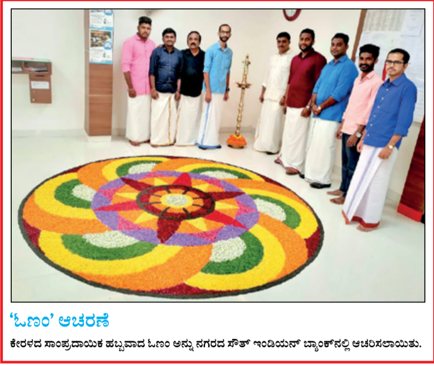
'ಓಣಿ' ಆಚರಣೆ ಕೇರಳದ ಸಾಂಪ್ರದಾಯಿಕ ಹಬ್ಬವಾದ ಓಣಿ ಅನ್ನು ನಗರದ ಸೌತ್ ಇಂಡಿಯನ್ ಬ್ಯಾಂಕ್‌ನಲ್ಲಿ ಆಚರಿಸಲಾಯಿತು.