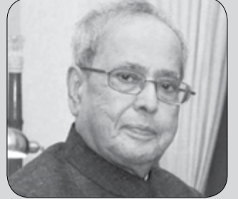
ಆರ್.ಎಸ್.ಎಸ್. ಜೊತೆ ವಿವಾದ

ನವದೆಹಲಿ, ಆ. 31 - ಕಾಂಗ್ರೆಸ್‌ನ ಮೂವರು ಪ್ರಧಾನ ಮಂತ್ರಿಗಳ ನಂಬಿಕೆಯ ಬಂಟಿ ಹಾಗೂ ಪಕ್ಷದ ನಿಷ್ಠಾವಂತರಾಗಿದ್ದ ಪ್ರಣಬ್ ಮುಖರ್ಜಿ ಅವರು, ಪ್ರಧಾನ ಮಂತ್ರಿ ಹುದ್ದೆಯ ಮಹತ್ವಾಕಾಂಕ್ಷೆಯಿಂದ ಸ್ವಲ್ಪದರಲ್ಲೇ ದೂರ ಉಳಿದರಾದರೂ, ರಾಷ್ಟ್ರಪತಿ ಭವನ ತಲುಪುವ ಮೂಲಕ ದೇಶದ ಪ್ರಥಮ ಪ್ರಜೆಯಾದರು. ದೇಶದ 13ನೇ ರಾಷ್ಟ್ರಪತಿಯಾಗಿದ್ದ ಮುಖರ್ಜಿ, ರಾಜಕೀಯ ದಿನಗಳಲ್ಲಿ ಕಾಂಗ್ರೆಸ್‌ನ ಸಮಸ್ಯೆಗಳನ್ನು ಬಗೆಹರಿಸುವಲ್ಲಿ ಮುಂಚೂಣಿಯಲ್ಲಿರುತ್ತಿದ್ದರು. ದೇಶದ ಅತ್ಯಂತ ಗೌರವಾನ್ವಿತ ರಾಜಕಾರಣಿಗಳಲ್ಲಿ ಒಬ್ಬರಾಗಿದ್ದರು. ಕೊನೆಯ ದಿನಗಳವರೆಗೂ ಜನತೆಯ ಒಡನಾಡಿಯಾಗಿದ್ದ ಮುಖರ್ಜಿ, ಆಗಸ್ಟ್ 10ರಂದು ತಮ್ಮ ಕೊರೋನಾ ಸೋಂಕು ಬಂದಿರುವುದನ್ನು ಟ್ವಿಟ್ಟರ್ ಮೂಲಕ ತಿಳಿಸಿದ್ದರು. ಇದು ಸಾರ್ವಜನಿಕ ಜೀವನದಲ್ಲಿ ಅವರ ಕೊನೆಯ ಮಾತಾಗಿತ್ತು. ಸಮಸ್ಯೆಗಳ ಎದುರಾದಾಗಲೆಲ್ಲಾ ತ್ವರಿತವಾಗಿ ಬಗೆಹರಿಸುವ ದಕ್ಷತೆ ತೋರುತ್ತಾ ಬಂದಿದ್ದ ಮುಖರ್ಜಿ, ಸಾರ್ವಜನಿಕ ಜೀವನದಲ್ಲಿ ಎಂದೂ ನೇಪಥ್ಯಕ್ಕೆ ಸರಿದವರಲ್ಲ. ರಾಷ್ಟ್ರಪತಿ ಸ್ಥಾನ ತೊರೆದ ನಂತರವೂ ಸಾರ್ವಜನಿಕ ಜೀವನದಲ್ಲಿ