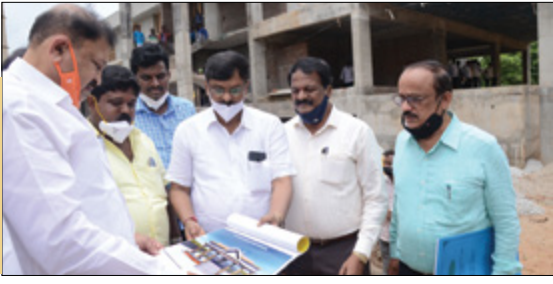
ವಾಲ್ಮೀಕಿ ಸಮುದಾಯ ಭವನ ನಿರ್ಮಾಣಕ್ಕೂ ಸಹ ಸರ್ಕಾರದಿಂದ ಅನುದಾನ ಕೊಡಿಸಲಾಗುವುದು. ಸಮಾಜದ ಮುಖಂಡರು ನಗರದ ಪಿ. ಬಿ. ರಸ್ತೆಯ ಬಳಿ ಜಾಗ ಹುಡುಕಿ ದೂಡಾಗೆ ಮನವಿ (2ನೇ ಪುಟಕ್ಕೆ)