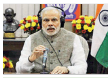
ಜಾಗತಿಕವಾಗಿ 7 ಲಕ್ಷ ಕೋಟಿ ರೂ.ಗಳ ಉದ್ಯಮವಾಗಿರುವ ಆಟಿಕೆಗಳಲ್ಲಿ ಭಾರತದ ಪಾಲು ತೀರಾ ಕಡಿಮೆ : ಪ್ರಧಾನಿ

ಭಾರತದಲ್ಲಿ ಹಾಗೂ ಭಾರತವನ್ನು ಆಧರಿಸಿದ ಕಂಪ್ಯೂಟರ್ ಗೇಮ್‌ಗಳನ್ನು ರೂಪಿಸುವಂತೆ ಕರೆ ನೀಡಿರುವ ಮೋದಿ, ಆಟಿಕೆ ಹಾಗೂ ಗೇಮಿಂಗ್ ವಲಯದಲ್ಲಿ ಅನ್ವೇಷಣೆಗೆ ಅಗತ್ಯವಾದ ಸಮೃದ್ಧ ಪರಂಪರೆ ಹಾಗೂ ಸಂಪ್ರದಾಯ ಇಲ್ಲಿದೆ ಎಂದಿದ್ದಾರೆ. ನಮ್ಮ ದೇಶದಲ್ಲಿ ಸಾಕಷ್ಟು ವಿಚಾರಗಳು ಹಾಗೂ ಪರಿಕಲ್ಪನೆಗಳು ಇವೆ. ದೇಶದ ಇತಿಹಾಸ