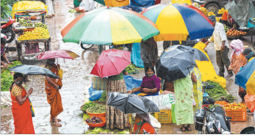
ಮಳೆ ಸಂತೆ ಭಾನುವಾರ ಬೆಳಿಗ್ಗೆಯಿಂದಲೇ ಜಿಟಿ ಜಿಟಿ ಮಳೆ ಶುರುವಾದ ಹಿನ್ನೆಲೆಯಲ್ಲಿ ವಾರದ ಸಂತೆಯನ್ನು ಕೊಡೆಗಳ ಆಶ್ರಯದಲ್ಲಿ ನಡೆಸಬೇಕಾಯಿತು. ಮಳೆಯಿಂದಾಗಿ ಗ್ರಾಹಕರು ಮಾರುಕಟ್ಟೆಯತ್ತ ಹೆಜ್ಜೆ ಹಾಕದ ಪರಿಣಾಮ ವ್ಯಾಪಾರ ಕಡಿಮೆ ಇತ್ತು.