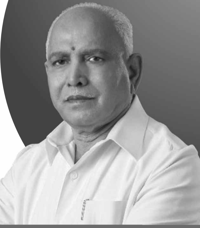
ಶ್ರೀ ಬಿ.ಎಸ್. ಯಡಿಯೂರಪ್ಪ ಸನ್ಮಾನ್ಯ ಮುಖ್ಯಮಂತ್ರಿಗಳು

ಮಾನ್ಯ ಪ್ರಧಾನಮಂತ್ರಿ ಶ್ರೀ ನರೇಂದ್ರ ಮೋದಿ ಅವರ ಆಶಯದಂತೆ, ಜೀವ-ಜೀವನ ಎರಡರ ಸಮತೋಲನಕ್ಕೆ ರಾಜ್ಯ ಸರ್ಕಾರ ಅವಿರತ ಶ್ರಮಿಸುತ್ತಿದೆ. ಆ ಮೂಲಕ ಅಭಿವೃದ್ಧಿ ಪಥದಲ್ಲ ಮುನ್ನಡೆದಿದೆ.