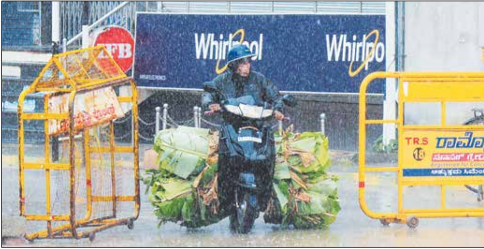
ಮಳೆ ಬಂದರೇನು? ಲಾಕ್‌ಡೌನ್ ಇದ್ದರೇನು? ಅಗತ್ಯ ವಸ್ತುಗಳ ಸೇವೆಗೆ ಅಡೆ ತಡೆ ಇಲ್ಲ. ದಾವಣಗೆರೆಯ ಅತೀವ ರಸ್ತೆಯಲ್ಲಿ ದ್ವಿಚಕ್ರ ಸವಾರನೊಬ್ಬ ಮಳೆಯಲ್ಲಿಯೇ ಸರಿಸಿಬಿಟ್ಟು ಬ್ಯಾರಿಕೇಡ್‌ಗಳ ನಡುವೆ ಬಾಕಿ ಎಲೆ ಕೊಂಡೊಯ್ಯುತ್ತಿರುವುದು.

ಒಳ ರಸ್ತೆಗಳನ್ನು ಹೊರತುಪಡಿಸಿ, ಬಹುತೇಕ ಮುಖ್ಯ ರಸ್ತೆಗಳು ಸ್ವಲ್ಪ