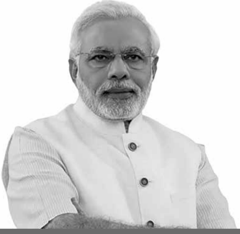
ಶ್ರೀ ನರೇಂದ್ರ ಮೋದಿ ಸನ್ಮಾನ್ಯ ಪ್ರಧಾನ ಮಂತ್ರಿಗಳು