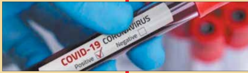
ಬರುತ್ತಿದೆ ಎಂದು ಸರ್ಕಾರವು ಆಸ್ಪತ್ರೆಯ ಪಲ್ಸರಿ ವಿಭಾಗದ ವೈದ್ಯರಾದ (2ನೇ ಪುಟಕ್ಕೆ)

ನಡೆಸಿದಾಗ ನೆಗೆಟಿವ್ ಬಂದಿವೆ. ನಂತರದಲ್ಲಿ ಮತ್ತೆ ಪರೀಕ್ಷೆ ಮಾಡಿದಾಗ ಪಾಸಿಟಿವ್ ಬಂದಿದೆ. ಕೊರೊನಾ ಸೋಂಕಿತರನ್ನು ಗುರುತಿಸಿ ಚಿಕಿತ್ಸೆ ಮಾಡಲು ಕೇವಲ ಆರ್.ಟಿ. - ಪಿ.ಸಿ. ಆರ್. ಫಲಿತಾಂಶವನ್ನು ಅವಲಂಬಿಸಬೇಕು. ಇದರ ಸಂವೇದನೆ ಕೇವಲ ಶೇ.70ರಷ್ಟಾಗಿದೆ. ಚಿಕಿತ್ಸೆಗಾಗಿ ಚಿಕಿತ್ಸಾತ್ಮಕ ಲಕ್ಷಣಗಳು ಹಾಗೂ ಸಿ.ಟಿ.ಸ್ಕಾನ್ ವರದಿಗಳನ್ನು ಅವಲಂಬಿಸಬೇಕು ಎಂಬ ಬಗ್ಗೆ ಸಾಮಾನ್ಯ ಅಭಿಪ್ರಾಯ ಮೂಡಿ