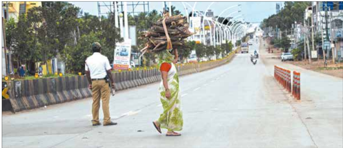
ಭಾನುವಾರದ ಲಾಕ್‌ಡೌನ್ ಹಿನ್ನೆಲೆಯಲ್ಲಿ ಅನಗತ್ಯವಾಗಿ ಓಡಾಡುವ ವಾಹನ ಸವಾರರಿಗೆ ಬಿಸಿ ಮುಟ್ಟಿಸಲು ಕಾಯುತ್ತಿರುವ ಪೊಲೀಸ್ ಒಬ್ಬರನ್ನು ಓಡಿಸಿ ಏನು ಲಾಕ್ ಆದರೇನು? ಹಸಿವು ನಿಗಿಸಲು ಕಟ್ಟಿಗೆಯೇ ಬೇಕು ಎಂದು ತಲೆ ಮೇಲೆ ಹೊತ್ತು ಹೊರಟ ಮಹಿಳೆ. ಒ.ಬಿ. ರಸ್ತೆಯಲ್ಲಿನ ಚಿತ್ರವಿದು.

ದಾವಣಗೆರೆ, ಜು. 12- ಭಾನುವಾರದ ಲಾಕ್‌ಡೌನ್ ಹಿನ್ನೆಲೆಯಲ್ಲಿ ನಗರ ಮೌನವಾಗಿತ್ತು. ಬೆಳಿಗ್ಗೆ 9 ಗಂಟೆವರೆಗೆ ಹಣ್ಣು, ತರಕಾರಿ, ಹಾಲು ಮಾರಾಟ ವ್ಯಾಪಾರವು ಸಂಪೂರ್ಣವಾಗಿ ನಿಂತಿತ್ತು. ಬೆಳಿಗ್ಗೆ 10 ನಂತರ ನಗರ ನಿಧಾನವಾಗಿ ಮೌನವಾಗತೊಡಗಿತು. ಪ್ರಮುಖ ರಸ್ತೆ ಹಾಗೂ ವ್ಯತ್ಯಾಸವಿಲ್ಲದ ವ್ಯಾಪಾರ ವಹಿವಾಟು ಸಂಪೂರ್ಣ ಸ್ಥಗಿತವಾಗಿತ್ತು. ಆದರೆ ಬಡಾವಣೆಗಳಲ್ಲಿ ಮಾತ್ರ